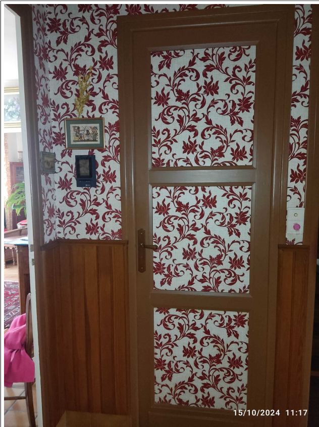
Position porte WC par rapport angle mue séjour et largeur entre porte WC et escalier