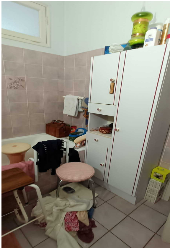
Fenêtre qui s'ouvre coté salle d'eau