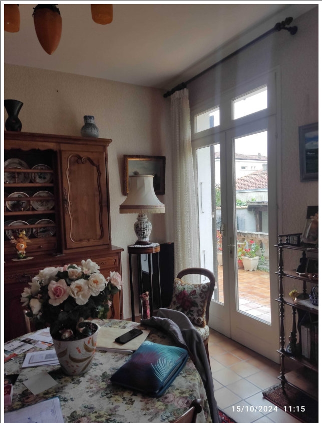
Vue du radiateur dans séjour coté mur cuisine