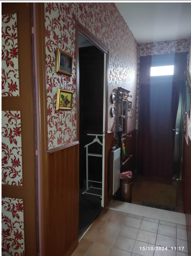
Position marche par rapport porte chambre