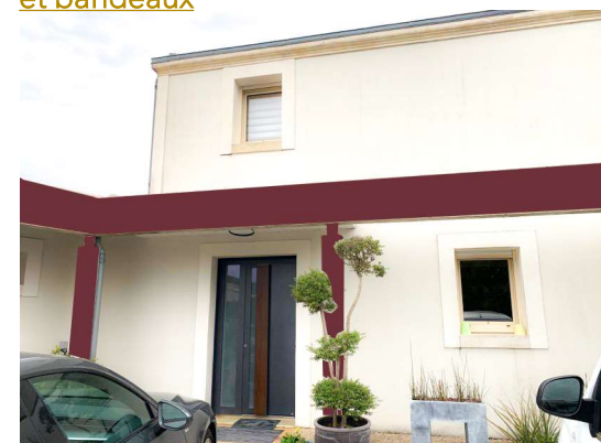
PROPOSITION 4 : Bordeaux sur poteaux et bandeaux