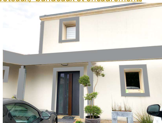
PROPOSITION 3 : Gris chaud sur poteaux, bandeaux et encadrements