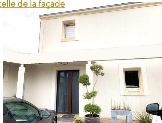
PROPOSITION 1 : Couleur identique à celle de la façade