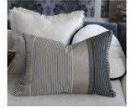
Tissu type Designers Guild - Orsoglio

Murs du dressing peints dans un blanc similaire aux façades des rangements