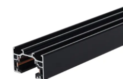
Rail INDIGO Track Uno 1 allumage noir 32x21mm

Ces plans ne sont pas des plans d'exécution et n'engagent pas la responsabilité de l'architecte d'intérieur.