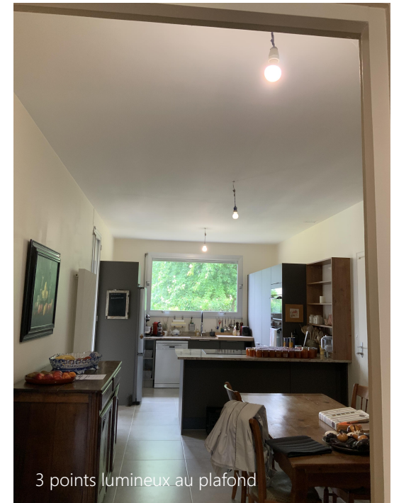
3 points lumineux au plafond