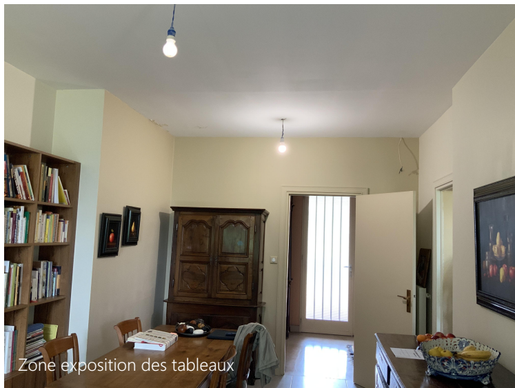
Zone exposition des tableaux