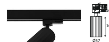
Spot INDIGO OKTO 3 T noir