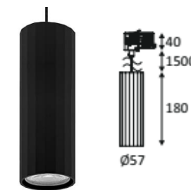
Spot INDIGO OKTO 3 TP noir