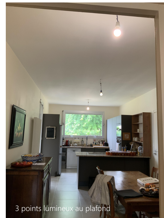
3 points lumineux au plafond