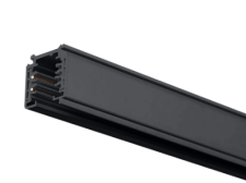
Rail INDIGO Track III Surface noir