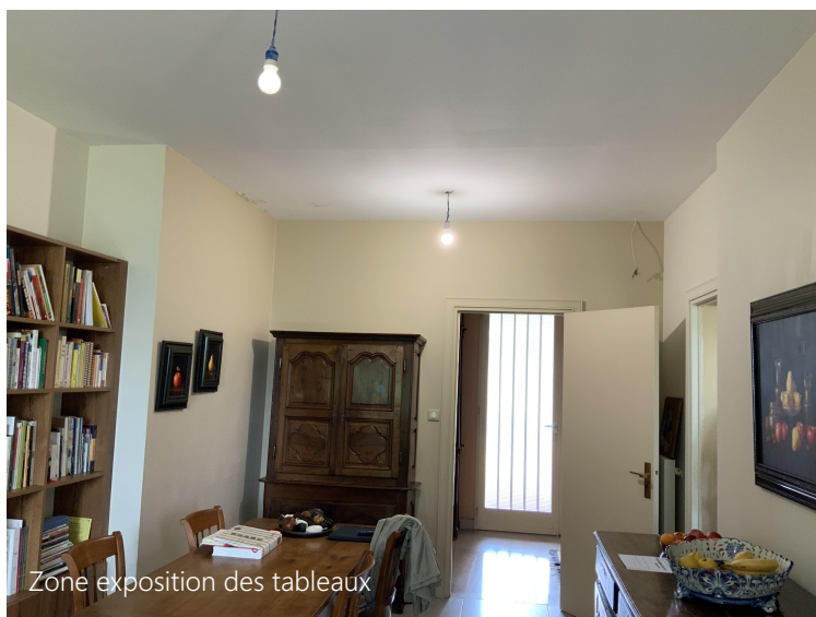
Zone exposition des tableaux