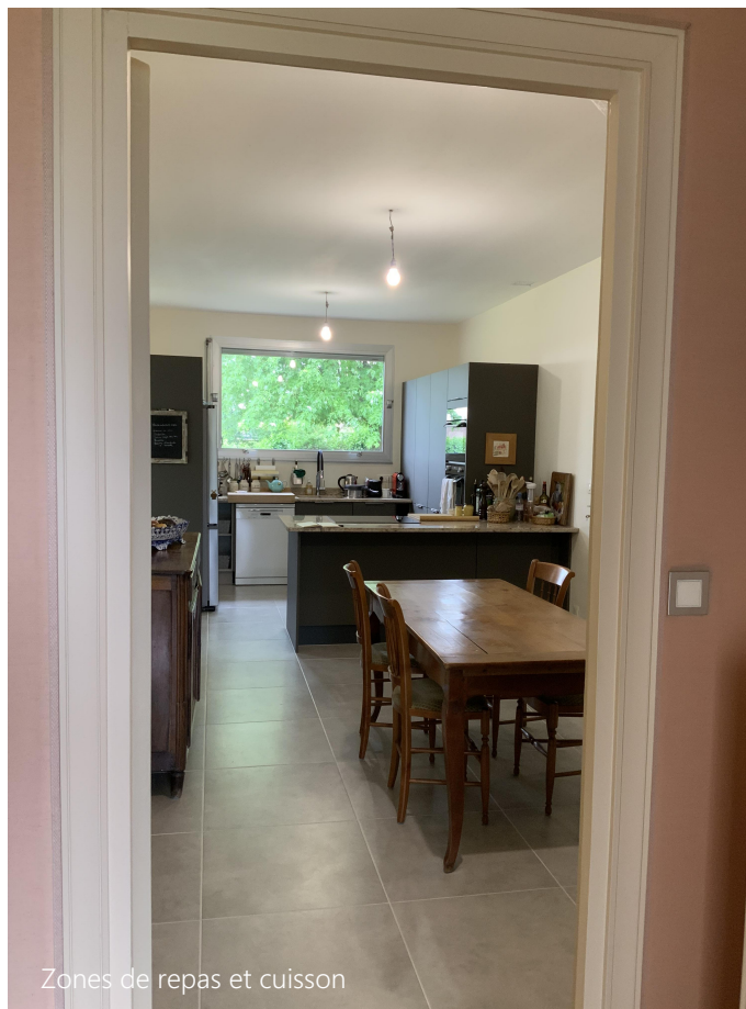
Zones de repas et cuisson