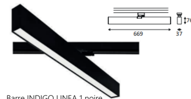
Barre INDIGO LINEA 1 noire