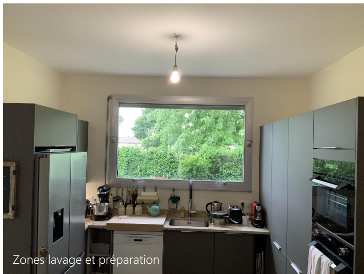
Zones lavage et préparation