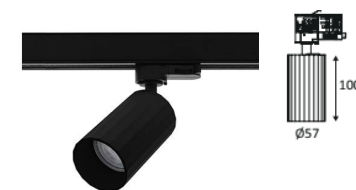
Spot INDIGO OKTO 3 T noir