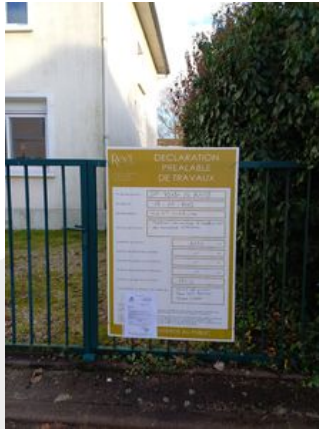
Affichage Dp 1